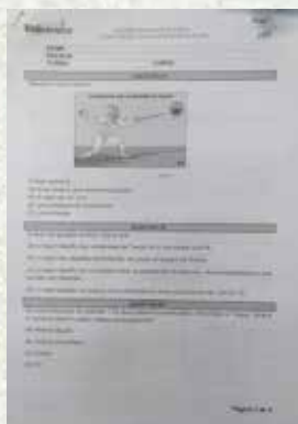
Caderno de prova

O malote contendo os Cadernos de Prova e Cartões Respostas utilizados ou não;